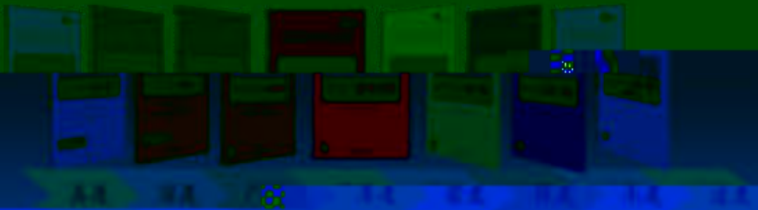
AA 级 实训 教学 设施 教学 设施 教学 设施